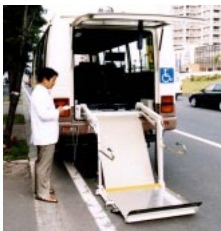
車椅子昇降用リフト付きバス

所有車輛のうち送迎用バス一両を改造して、車イスのまま乗車・降車できるようにしました。 電動式安全リフトと車イス固定装置が設置され、4人まで利用できます。